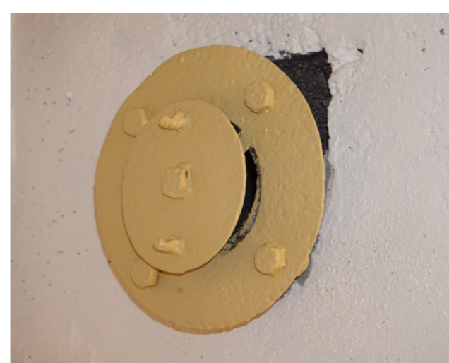
Bouche d'air alimentée par le ventilateur

Pour la ventilation du local, l'air était filtré par le système anti gaz de la casemate.