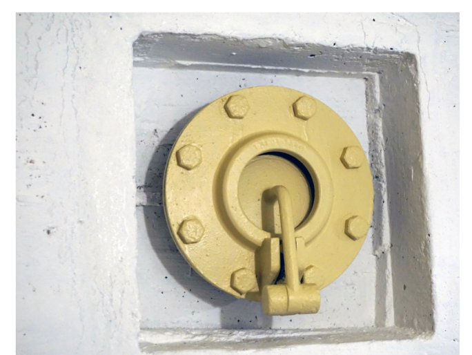
Clapet à bascule de circulation d'air dans le local