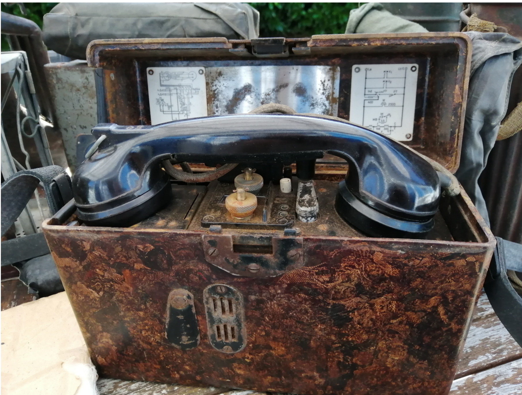
Téléphone de campagne