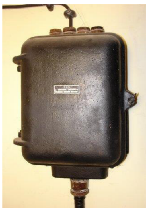
Exemples de lampe hublot de boîtier de dérivation.