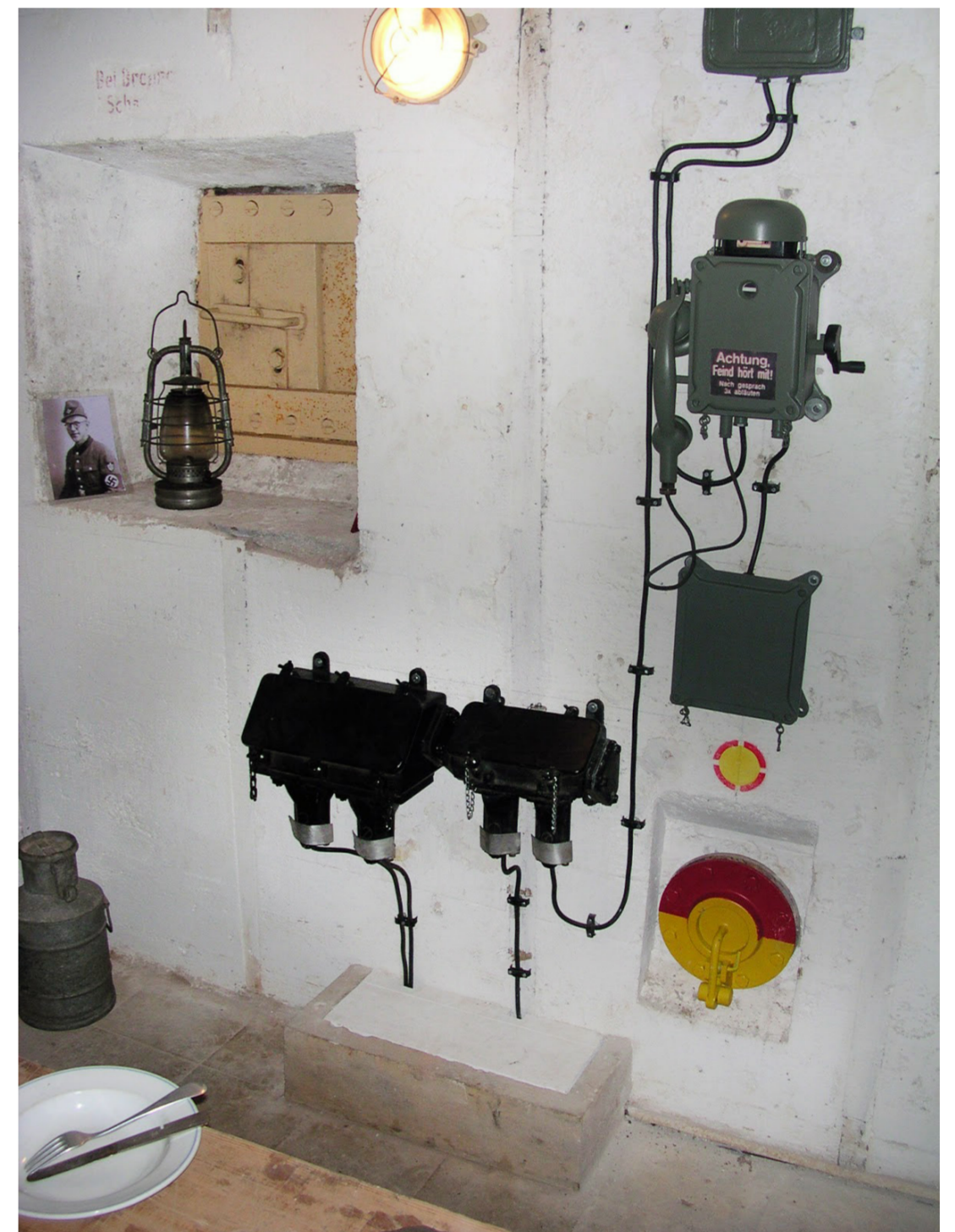
Système de connexion de casemate