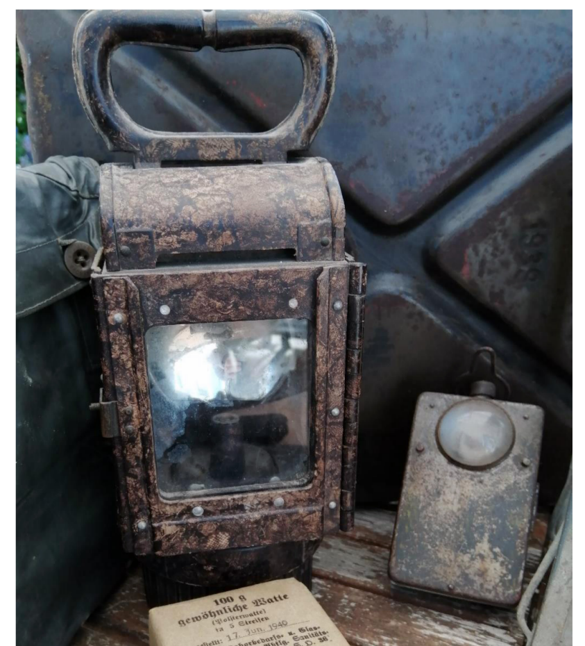
Lanterne à carbure allemande polyvalente (Einheitslaterne 37)