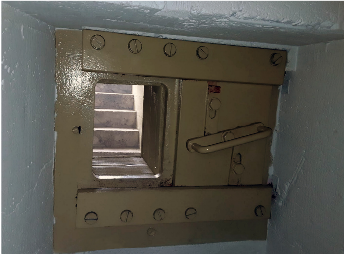
Illustration d'une meurtrière complète. Ce poste de tir prend en enfilade l'escalier d'accès du blockhaus.

Ces portes ont été démontées après guerre.