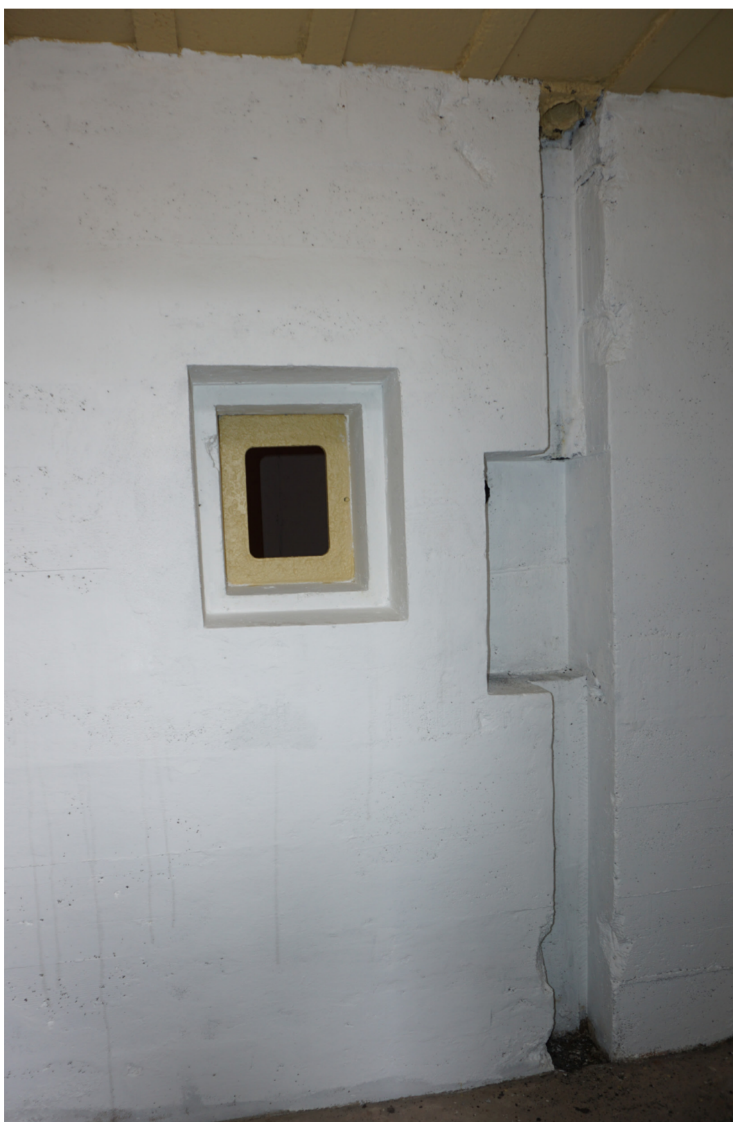
Meurtrière incomplète au Pouldu.