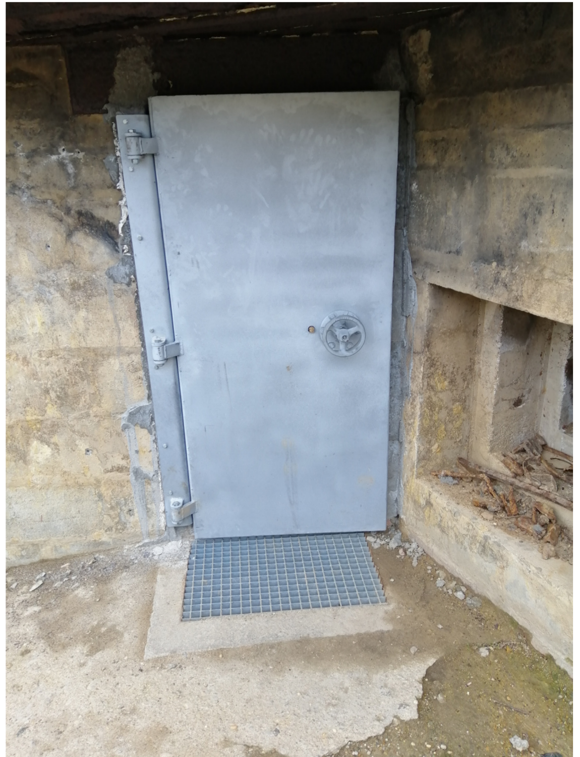
Porte en acier réalisée par les services techniques de la commune

Le couloir distribue l'accès au reste des salles et à l'entrée du personnel.