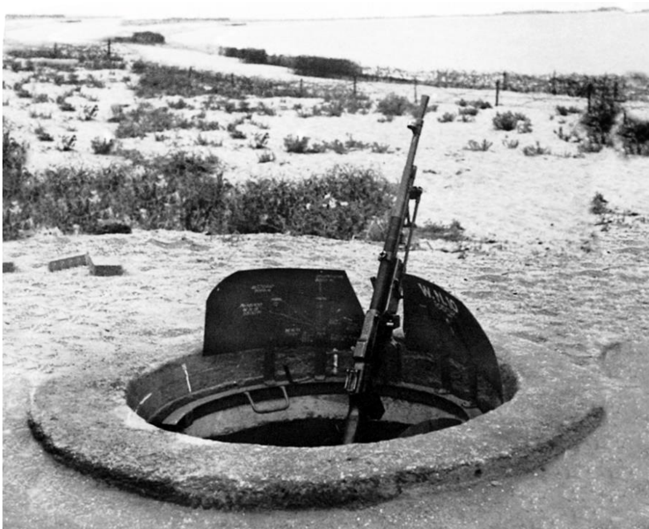
La mitrailleuse est protégée par un bouclier monté sur rail circulaire.