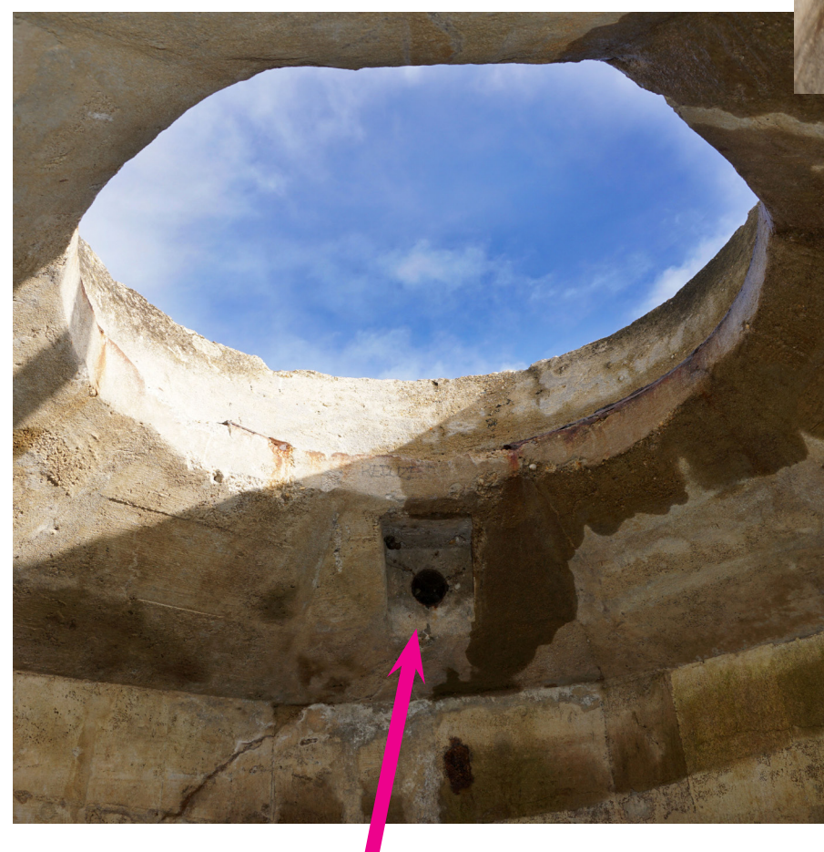
Cornet de communication acoustique relié à la casemate.