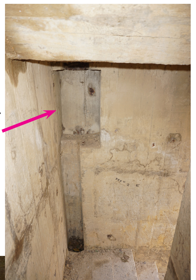
Une cheminée de sortie d'antenne est présente sur le côté.

C'était un poste de tir, de surveillance et de direction de tir de la position. En effet, il est doté d'un puit de descente d'antenne radio afin de communiquer des indications de tirs aux autres unités de combat d'artillerie (cannons, mortiers, batteries de côte).